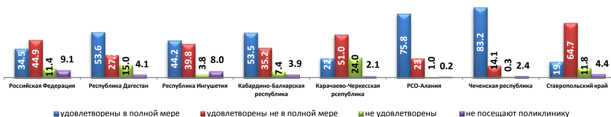
Оценка домохозяйствами работы поликлиники, к которой прикреплены члены домохозяйства (в процентах)

Также оценивались трудности с вызовом скорой медицинской помощи . По результатам опроса 58% жителей республики не вызывали скорую помощь, 41% - не имели трудностей с вызовом скорой медицинской помощи и только 0,8% при вызове «скорой» сталкивались с затруднениями различного характера.